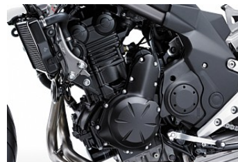
Kompakter, drehfreudiger Motor