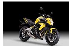
Pearl Shining Yellow

Trendigen Lifestyle im Einklang mit der persönlichen Leidenschaft erfahren und immer stilvoll ankommen. Mit der neuen ER-6n sind Fahrten in der City keine Pflicht, sondern ein stylisches Erlebnis.