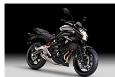
Metallic Spark Black