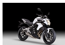
Pearl Stardust White