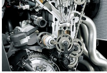
Höhere Leistung im mittleren Drehzahlbereich