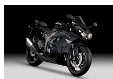
Metallic Spark Black / Flat Ebony