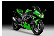
Lime Green / Metallic Spark Black (Grün/Schwarz)

In der Supersport-WM der Herausforderer, Sieger in den Straßentests der Fachmagazine. Kawasaki hat die Mittelklasse im Supersport erfunden - Sie profitieren vom Resultat unserer Erfahrung und unseres Erfolges.