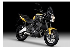
Pearl Solar Yellow/Ebony (Gelb/Schwarz)

Die äußerst vielseitige Versys ist für alle Einsatzzwecke geeignet – für die Fahrt zur Arbeit, für die Tour oder einfach für den Spaß an der Freude. Jede Straße, jederzeit, die Versys ist immer erste Wahl.