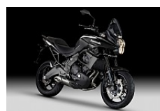
Metallic Spark Black (Schwarz)