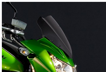
WINDSCHUTZSCHEIBE € 73,30